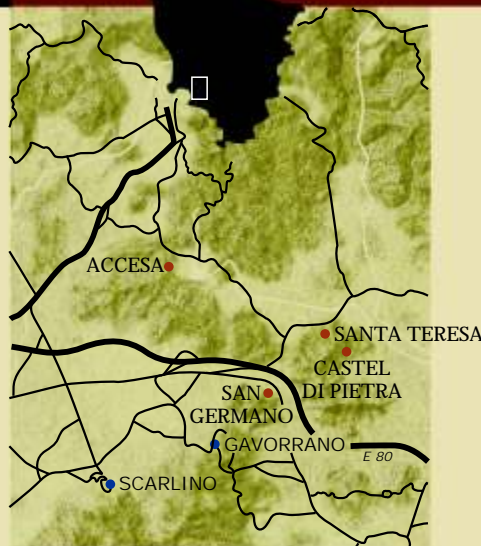
ARISTOCRAZIE AGRICOLTURA COMMERCIO Etruschi a Santa Teresa di Gavorrano MOSTRA ARCHEOLOGICA

Orario luglio e agosto dal martedì al sabato 16,00 - 20,00 domenica 10,00-13,00/ 16,00-20,00 settembre sabato e domenica 10,00/13,00 ottobre . novembre . dicembre domenica e festivi 10,00-13,00