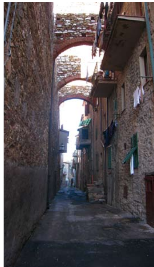
Caldana: centro storico

Ci sarà un intervento anche su Via Montanara limitato al montaggio di tre corpi illuminanti "a parete" che verranno aggiunti nel lato ovest della via, in modo sfalsato a quelli già posizionati sul lato opposto. Prossimamente l'Amministrazione Comunale presenterà il progetto esecutivo alla cittadinanza di Caldana in un apposito incontro pubblico.