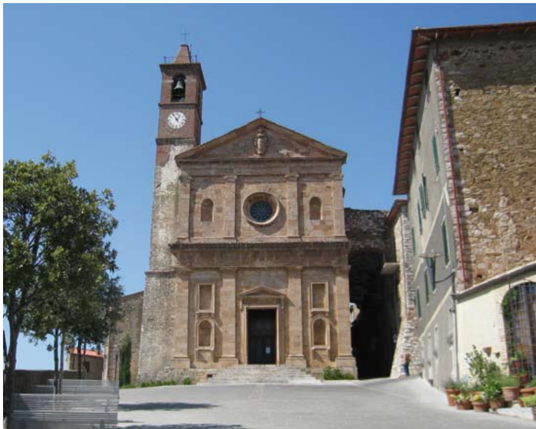
Caldana: chiesa di San Biagio

I lavori interesseranno Via Solferino, Via Curtatone, Via del Palazzetto, e Piazza Signori