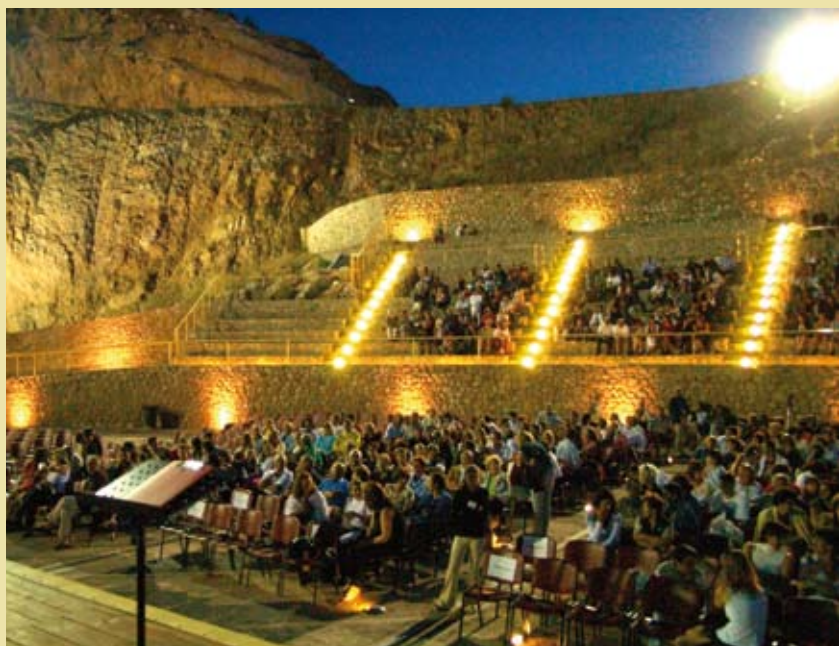
il Teatro delle Rocce

21 Spettacoli ed oltre 13 mila spettatori per la stagione estiva 2008