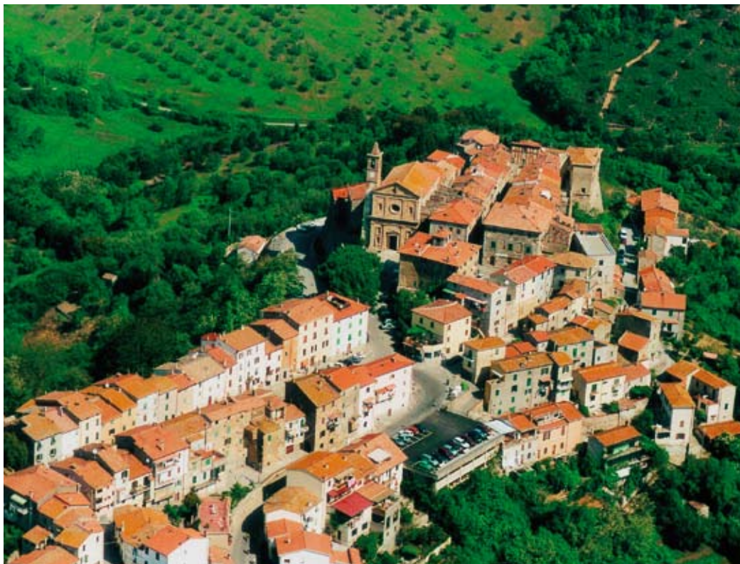
Caldana, foto aerea

1) Rafforzare i settori che possono creare sviluppo economico, ricchezza e nuova occupazione. Questi settori sono rappresentati principalmente da turismo, agricoltura e manifatturiero. Rafforzare le strutture ricettive turistico alberghiere, mediante incremento dei posti letto alberghieri (attualmente inesistenti) sia con la previsione di una struttura alberghiera in ogni centro urbano, sia mediante gli alberghi di campagna (realizzati dalle aziende agricole), per una previsione totale di 630 nuovi posti letto. Sono confermate le tre strutture turistiche previste nel PRG (Pelagone, Inferno, Santa Croce) le quali dovranno essere realizzate entro cinque anni. Si punta in maniera particolare sulla possibilità di recupero delle acque calde della miniera per fini termali, progetto che darebbe una straordinaria svolta all'offerta turistica del comprensorio. Il Regolamento Urbanistico prevede oltre 27.000 mq di nuova superficie di pavimento attraverso un consistente ampliamento della zona delle Basse di Caldana come polo delle attività artigianali e industriali manifatturiere ed il completamento di quelle di S.Giuseppe e La Merlina. Le attività più "leggere" come i pubblici esercizi, il commercio al dettaglio, il piccolo artigianato, ecc. sono individuate invece all'interno dei paesi. L'agricoltura sta vivendo una nuova stagione di rinascita soprattutto grazie agli investimenti sulla viticoltura; alla fine del 2006 le superfici vita-