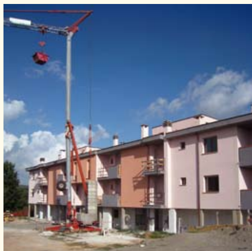
Bagno di Gavorrano, zona PEEP 167