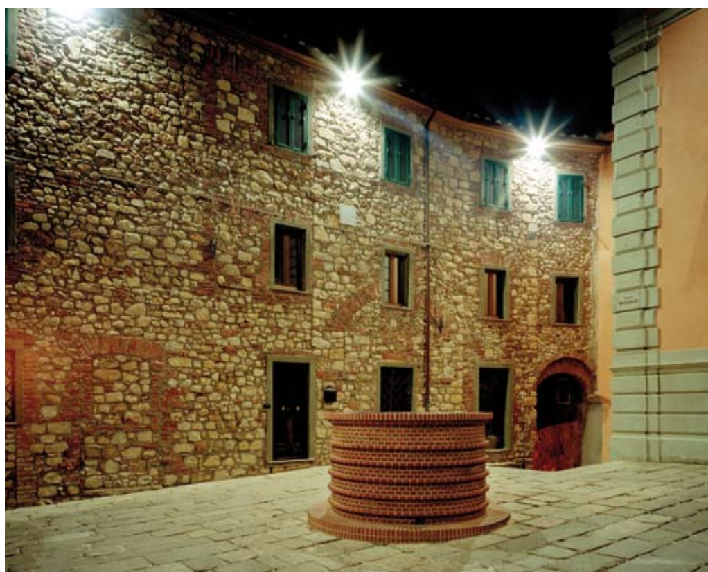
Gavorrano Centro Storico

Il Consiglio Comunale (nella seduta del 30 ottobre convocata per le ore 15 nella sala consiliare) è chiamato ad adottare il Regolamento Urbanistico, completando così la seconda fase di un percorso (iniziato tra gli anni 2005/2006, con il Piano Strutturale) che mira a dotare il Comune di Gavorrano di un nuovo strumento di governo del territorio che sostituirà definitivamente il vigente Piano Regolatore Generale.