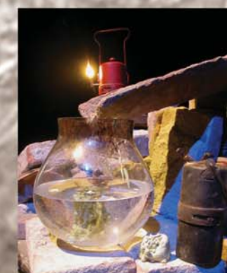
TEATRO DELLE BRICIOLE

Laboratorio è una parola che ci piace e che sta bene con Il Teatro delle Rocce. Laboratorio Gavorranoidea è la nuova istituzione creata per gestire i progetti e le attività culturali del Comune di Gavorrano, in modo particolare il Parco Minerario e il Teatro.